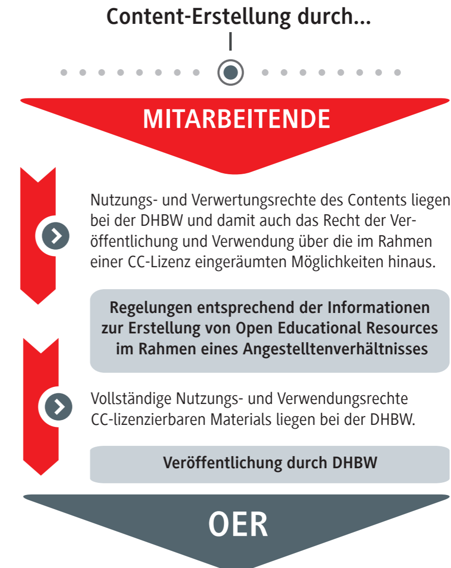
Abbildung 4: Prozess der OER-Erstellung und -Veröffentlichung durch Mitarbeitende im Angestelltenverhältnis.

damit beauftragt werden, OER zu erstellen und/oder zu veröffentlichen.