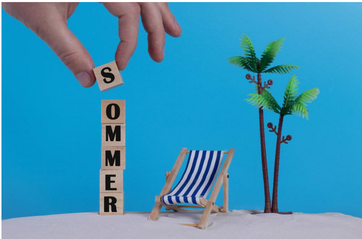
Foto: " Hand with wooden blocks wiht Sommer text and beach chair on blue background " von Marco Verch via ccnull.de , CC-BY 2.0 , verkleinert